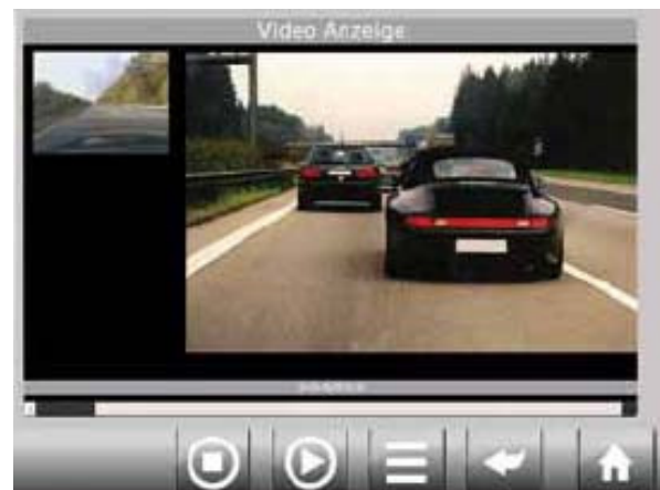
(Fotos: Innenansicht der Displayeinheit mit Kamera und Darstellung der Videobilder im Fahrzeug)