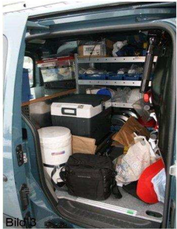
Renault Kangoo Rapid 1,5 dCi