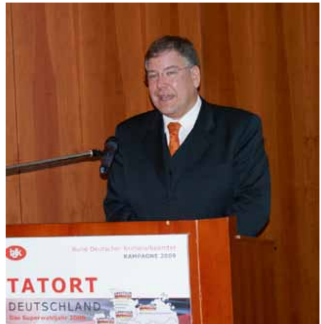
Innensenator Christoph Ahlhaus bei der Fachtagung „Tatort Deutschland – Tatort Internet“ des BDK Hamburg am 23.09.09 im Steigenberger Hotel

Die erhebliche Inanspruchnahme der Rechtsschutzversicherung und der kostenlosen anwaltschaftliche Erstberatung in zivilrechtlichen Streitigkeiten zeigen, dass es sich hierbei um ganz wichtige Säulen des Leistungsangebotes der Mitgliedschaft handelt.