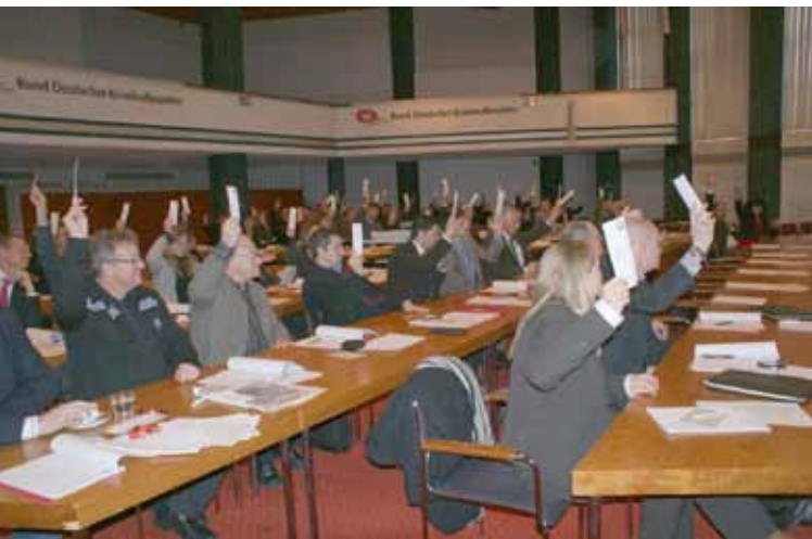
Die Delegierten bei der Antragsabstimmung

Die Organisation der Verbrechensbekämpfung ist also Veränderungen unterworfen: Hier wird der BDK weiterhin Gelegenheit finden, sich im Sinne einer aufgabenorientierten, fachlich sinnvollen Verbrechensbekämpfung einzubringen.