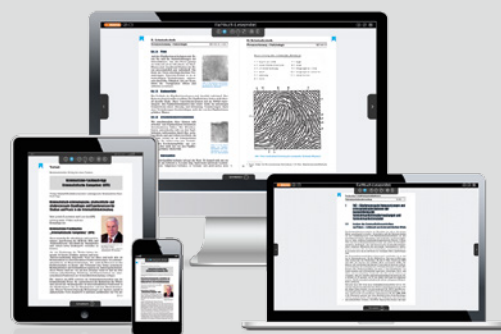
Kriminalistisches Fachbuch (KFB) als App für Tablet, Handy und PC